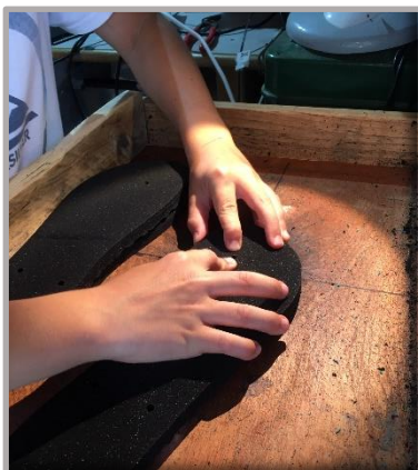
Figure 4 - Fraisage

La promotion du territoire de vie (et de sa qualité) est au cœur de la démarche entrepreneuriale.