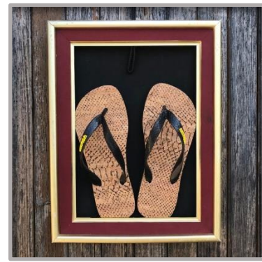
Figure 7 - Biscaïa entre au musée...

Si l'artisanat est sans aucun doute un art de vivre, Matthieu DUVAL illustre combien cet art de vivre est dans l'ère du temps : le modèle de croissance, respectueux de la nature et de ses ressources, se décline dans les territoires, au plus près de l'océan notamment.