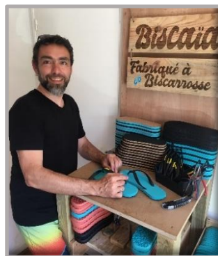
Figure 2 - Assemblage

Aujourd'hui, après de nombreux tests et quelques préséries, Biscaïa lance sa première production au printemps 2021. »