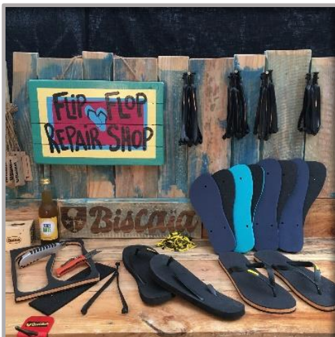
Figure 8 - Réparation éco-responsable de la Biscaïa

Si l'artisanat est sans aucun doute un art de vivre, Matthieu DUVAL illustre combien cet art de vivre est dans l'ère du temps : le modèle de croissance, respectueux de la nature et de ses ressources, se décline dans les territoires, au plus près de l'océan notamment.