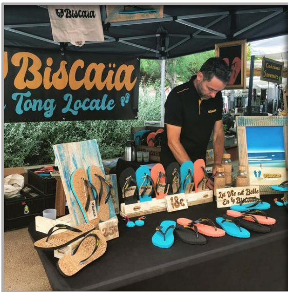
Figure 1 - Sur les marchés