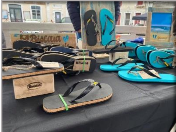
Figure 3 - Aperçu de la gamme de produits

Matthieu DUVAL est manifestement un entrepreneur prometteur.