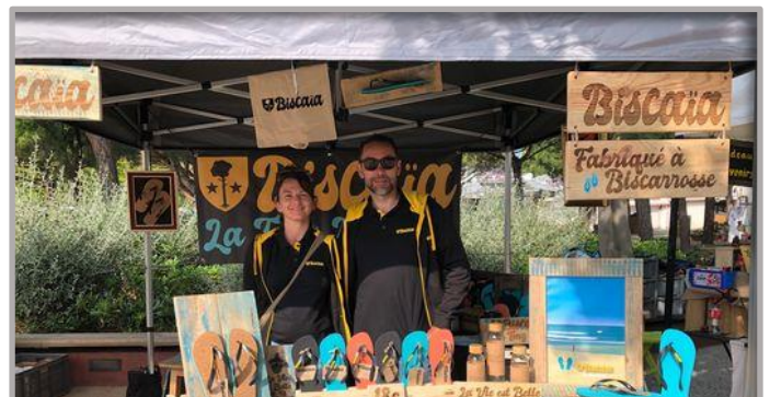
Figure 9 – La boutique itinérante Biscaïa : un modèle économique en cours de déploiement