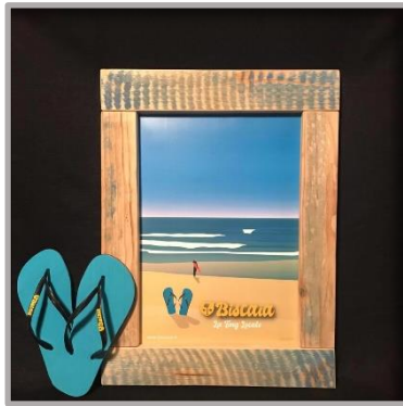
Figure 6 – Cadre en bois de palettes, Affiche de David Guerin (Guerin Illustrations)

Le recyclage est un véritable choix d'entreprise, que l'on retrouve dans la production cela va de soi, mais aussi dans les supports de communication : la matière est ainsi détournée de son identité première, ce qui génère une valorisation esthétique, en harmonie avec le concept Biscaïa (le bois de palettes, par exemple).